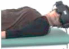
[3] Vestibulaire module 1 : les VPPB, Vertiges Positionnels Paroxystiques Bénins [3] et recommandations HAS